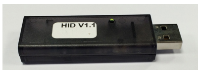
VECCHIA CHIAVE RF

La nuova chiave USB bluetooth BrightLogic consente una più facile comunicazione tra PC/portatile e sistemi di dosaggio BrightLogic abilitati. La nuova chiave bluetooth di BrightLogic non è compatibile con le versioni precedenti; la chiave RF precedente è ancora necessaria per i sistemi di dosaggio BrightLogic antecedenti a dicembre 2018 ancora in uso. È facile identificare le unità di dosaggio BrightLogic con il sistema aggiornato bluetooth perchè hanno il simbolo bluetooth sopra allo schermo LCD. Questa tecnologia bluetooth è specifica del sistema di dosaggio BrightLogic per lavanderia, il bluetooth che si trova nella maggior parte di PC/portatili non riuscirà ad effettuare l'accoppiamento con il sistema di dosaggio BrightLogic per lavanderia.