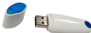
NUOVA CHIAVE BLUETOOTH